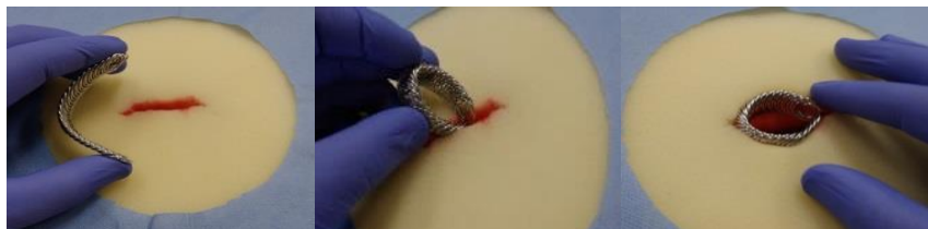
【スパイラルリトラクター】 容易にセッティングが可能で視野がきれいに保てます