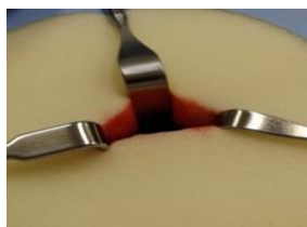
【従来法】 筋鉤が数本必要となり視野が狭い